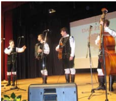
oktet, skeč iz KUD Vrhpolje, ansambel Svetlin in prvič v Moravčah ansambel

V programu prireditve smo videli vrtčevsko folklorno skupino, slišali vrtčevske otroke v pesmi in besedi, Mešani pevski zbor Društva upokojencev Moravče, Vokalno skupino Oda, Peški