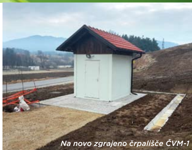
Na novo zgrajeno črpališče ČVM-1

Na območju občine Moravče je potekala gradnja in posodabljanje treh vodovodov, in sicer vodovodov Podbrdo-Grmače-Dešen, Soteska-Podstran-Dole in Hrastnik-Kal-Tlačnica. Na zadnjem vodovodu potekajo še zaključna dela, kot so namestitev električne inštalacije in priključitev na že obstoječi vodovod. Z njim bodo tamkajšnji prebivalci prvič dobili javni vodovod. Tudi dela na vrtini ČVM-1 se zaključujejo. Trenutno se urejuje okolica in se namešča električna inštalacija. Dela na tej vrtini se bodo zaključila še v tem mesecu. Med zaključna dela spadajo tudi priključitev povezovalnega vodovoda na obstoječi vodovod pred vodohranom Pogled,